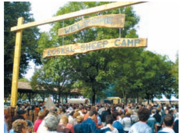
Jende andana polita bildu zen. 'Welcome Euskal Sheep Camp' emaiten zuen ongi-etorria seinaleak.