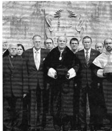
Deustuko unibertsitatean egin biltzar batean, Juan Jose Ibarretxe lehendakariak gaitzetsi ditu bipil bipila asteburuko atentatuak.

ETA-k bi bomba-auto zapartarazi ditu Vital Kutzaren egoitza berriaren aurrean, Gasteizen, eta Ondarroako (Bizkaia) polizia-etxearen ondoan. Leherketek kalte material handiak eragin dituzte. Gasteizeko bonbak kalte materialaz aparte, zauririk ez badu eragin, zazpi lagun zauritu ditu Ondarroan, hiru ertzain eta lau herritar. Adituen arabera zinezko sarraskia egin nahi izan du ETA-k Ondarroako bonbarekin Ertzaintzaren kontra. Gasteizeko auto bonbaren berri emana izan bazen dei baten bidez, Ondarroakoan aldiz ez da abisurik izan. Bestalde Espainiako Polizia Nazionalako agenteek lapabomba bat atzeman dute polizia baten auto partikularren azpian eratzia. Polizak 10 kilometra egin ditu auto azpian lehergailua bazeramala. Basauriko Polizia Nazionalaren egoitzara heldu denean ikusi dute lehergailua autoaren azpian.