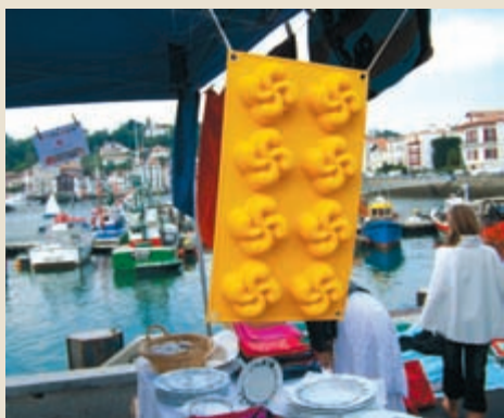
Lauburu itxurako orkeiak, lehenak aurtun agertuak...