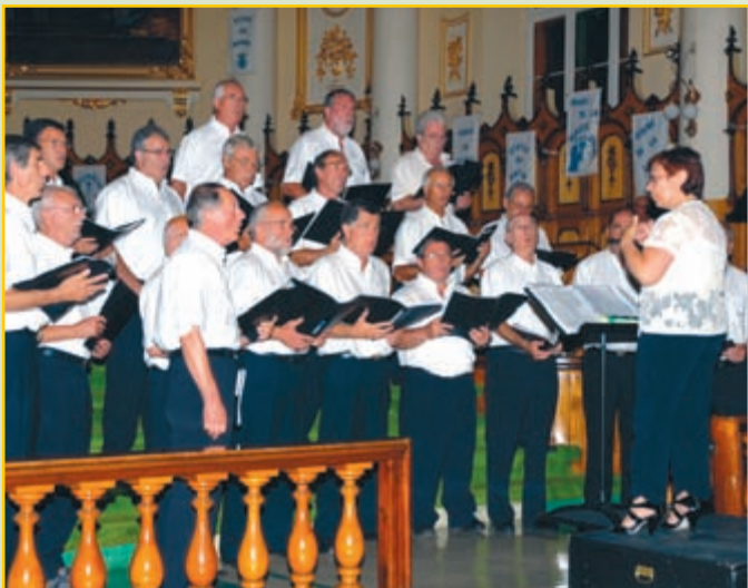
Trois-Pistoles hiriko elizan