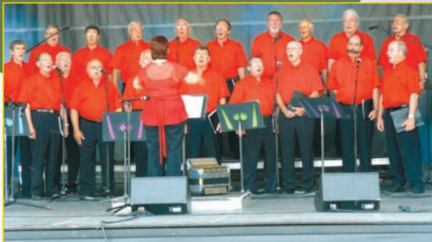
Argileak koroa, Quebec-en 400 urteburukari eskaintako kontzertuan