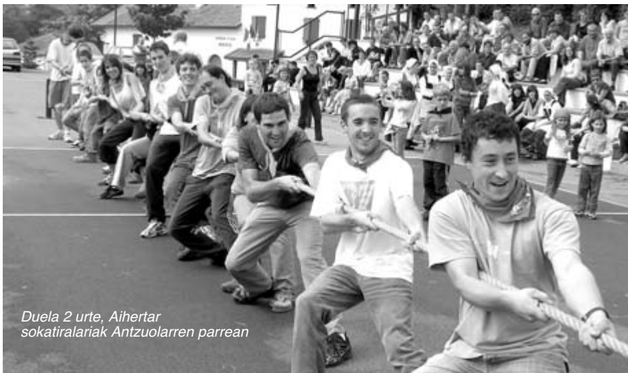
Duela 2 urte, Aihertar sokatiralariak Antzuolaren parrean