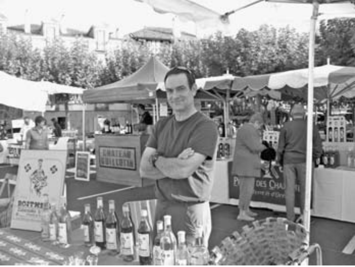
Jakes Sarraillet ere Xuberotik Donibanerak jina, Xuberoko "Bostmendi" basaran edariaren ezagutarazterat.

Donibane Lohizunen , Bizi Ona elkarteak portu bazterrean muntatua zuen joanden larunbatean bere merkatu berezia, arrakasta ederra ukan duena, aroa ere arrunt alde! Bazen segurki gauza ona frango: arrain, antzara eta ahateki kontserbuko, arno buxundatu eta edari, erreximeta mota asko, gerezi, ahabi eta beste, ardi gasna, biper eta biperki, aran melatu, urdeki, denetarik... Txalaparta xorta batzu ere bazterren aiosteko! Ohorezko gomitatekin hor ziren Tambourin bai-gorriar aita-semeak, ardi gasna arraroa egiten dutenak.