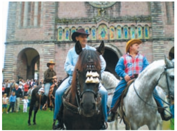
Zaldi gaineo bakeroek hasi zuten kabalkada iragan igandean Elizondon

Egun zinez ederra izan da iragan igandean Baztango Elizondon, Ameriketako artzain izan zireneri eskainia. Aitzineko urteetan Sunbillan, Lesakan, Aldude eta Gernikan egin bezala, aurtun Baztanen egin da amerikanoen ohoretan antolatuta besta hau, andana bat jende bildurik eta Ameriketako euskaldunek zeramaten bizimolde eta ohidurak bilduz eta erakutsiz. Eguna goizeko hamarretan meza nagusiarekin hasi zen Elizondoko Santiago elizan, ondotik kabalkada bat egin zelarik, gisa amerikanoen zaldi gaineo bakeroak buru.